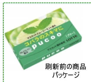
刷新前の商品 パッケージ