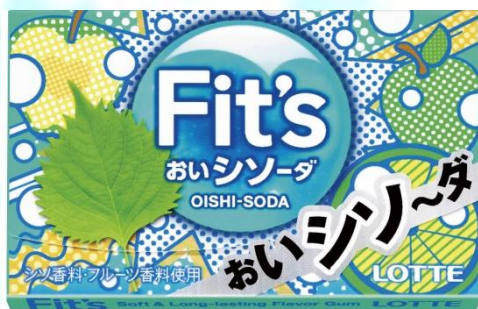
【〈おいシソーダ〉商品構造】