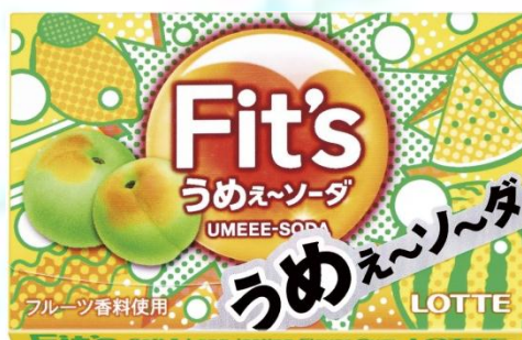
【〈うめえ～ソーダ〉商品構造】