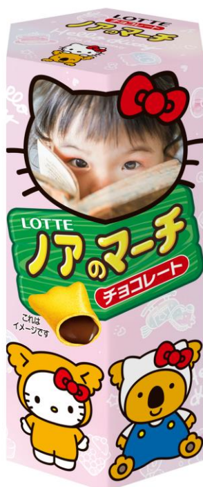
◆「ハローキティ ～クリアキティ～」 デザイン

公式サイト： https://lotte-shop.jp/shop/contents1/my-koala.aspx