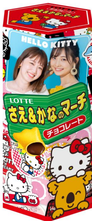
◆「ハローキティ ～キティと旅する未来～」 デザイン