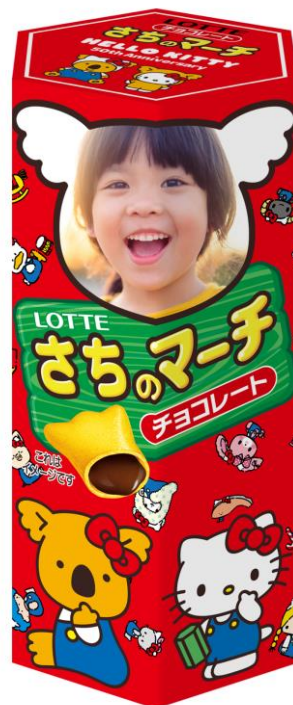
◆「ハローキティ ～パーティータイム～」 デザイン

※上記人物の画像・名前はサンプルです。実際の商品にはお客様指定の画像と名前が入ります。