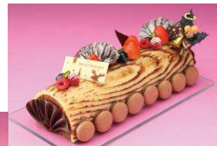
ブッシュ・ド・ノエル