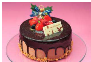
ミロワールクリスマス

ミロワールクリスマス 4,000 円(サイズ直径 15 cm) あふれ出すカカオの芳香と、フランボワーズの甘酸っぱさが絶妙なショコラクリームをたっぷりと使用しました。軽やかな食感と爽やかな後味をお楽しみください。