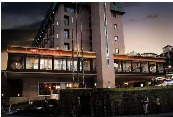
ANA クラウンプラザホテル長崎グラバーヒル 外観(イメージ図)