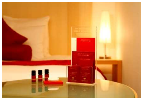
ANA クラウンプラザホテル オリジナル快眠プログラム「Sleep Advantage」