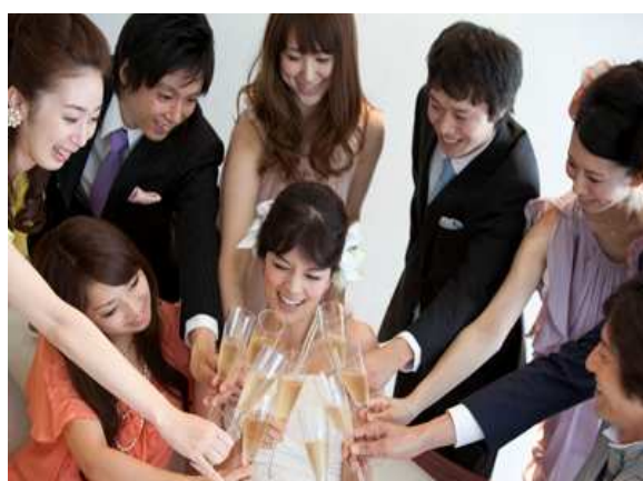
ANA クラウンプラザ・ウェディング オリジナルサービス(チャットコーナー)