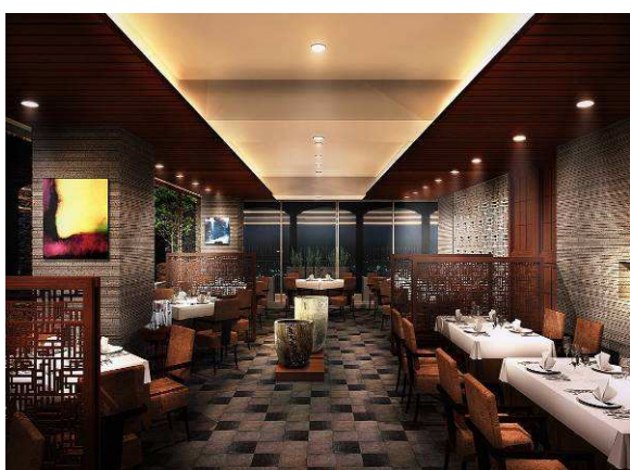
ダイニング ラ・ベルヴュー(イメージ図)