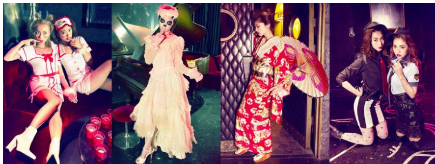
↑ 左から 赤ちゃんナース/死んだ花嫁/花魁/ハンサムなポリス

ここ数年、急激にハロウィンの時期にコスプレ（仮装）を楽しむ人たちが増え、量販店やバラエティショップは専用の衣装やグッズが並び、テーマパークや六本木などの繁華街やクラブは、大盛り上がりしています。そうしたことを背景に、本書を企画。