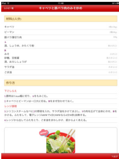
iPad版 「シリコンスチームなべ 使いこなしレシピ」 レシピ詳細画面