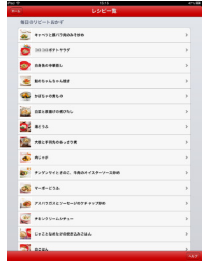
iPad版 「シリコンスチームなべ 使いこなしレシピ」 レシピ一覧