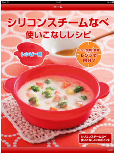
iPad版 「シリコンスチームなべ 使いこなしレシピ」 アプリ起動画面