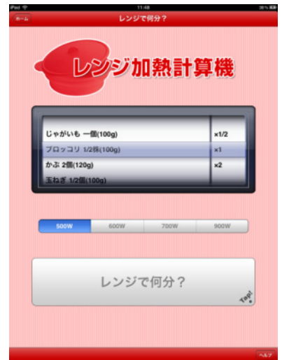
iPad版 「シリコンスチームなべ 使いこなしレシピ」 「レンジ加熱計算機」機能