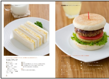
【10大定番メニュー】 たまごサンド、ハンバーガー、 ピザトースト、カツサンド 他