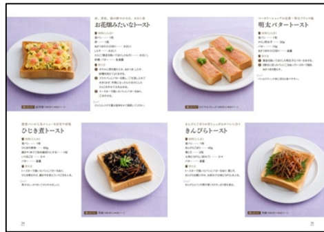
【和トースト】 ちりめんじゃこの和風トースト、ひじ き煮トースト、明太バタートースト 他