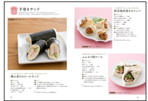
【手巻きサンド】 磯の香りのロールサンド、飲茶風肉巻 きカナッペ、ちくわ天ロールサンド 他