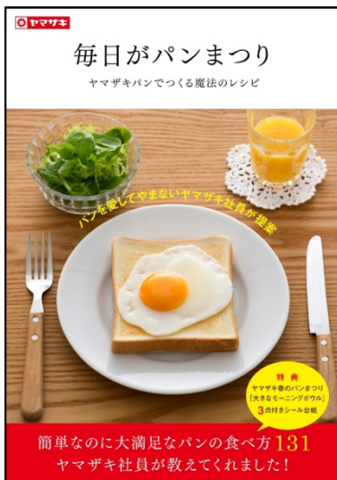
← 【3点付きシール台紙】