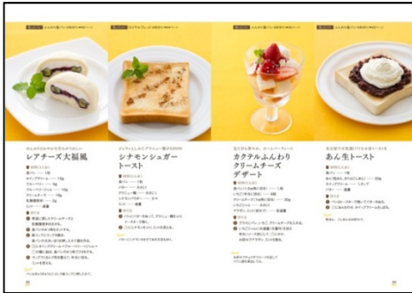
【スイーツ】 レアチーズ大福風、パンプディング、カクテ ルふんわりクリームチーズデザート 他