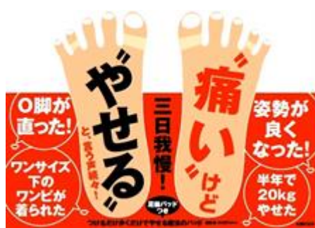
写真② 書店用 POP