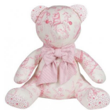
Chanteloup (シャンテルー) テディベア・ベビーサイズ ¥15,000

↑アメリカのテレビドラマ『デスパレートの妻たち』の主人公・ブリーの家の食器としても使用されたもの。すべてが職人の手焼きでオリジナルな作品。