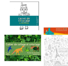
Mon Petit Art (モン・プティター) 男の子向けカラーリングブックセット ¥4,200

↑日本でも人気のデザイナーNathalie Lété(ナタリー・レテ)作のぬり絵など、アート教育玩具。こどもだけでなく、大人も楽しみ、インテリアの装飾品としても映える。