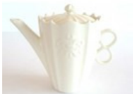
Antheor (アンテオール) ティーポット ¥5,200

↑アメリカのテレビドラマ『デスパレートの妻たち』の主人公・ブリーの家の食器としても使用されたもの。すべてが職人の手焼きでオリジナルな作品。