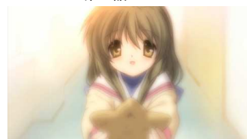
(C) 高屋奈月／白泉社・テレビ東京・NAS・フルバ製作委員会 (C) 緑川ゆき・白泉社／「夏目友人帳」製作委員会 (C) VisualArt's/Key/光坂高校演劇部

さらに、特集連動キャンペーンとして、特集期間中、「CLANNAD」第1話～第9話を有料会員限定で無料配信いたします。