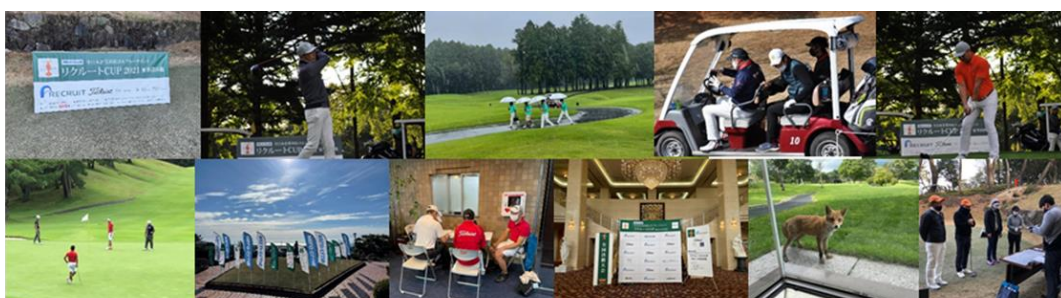
▲夏季団体戦2021の様子

自然の中で「三密」を避け、ソーシャルディスタンスに気を付けてプレーすることにより、従業員の方々の健康維持・ストレス解消のお手伝いできればと考えております。