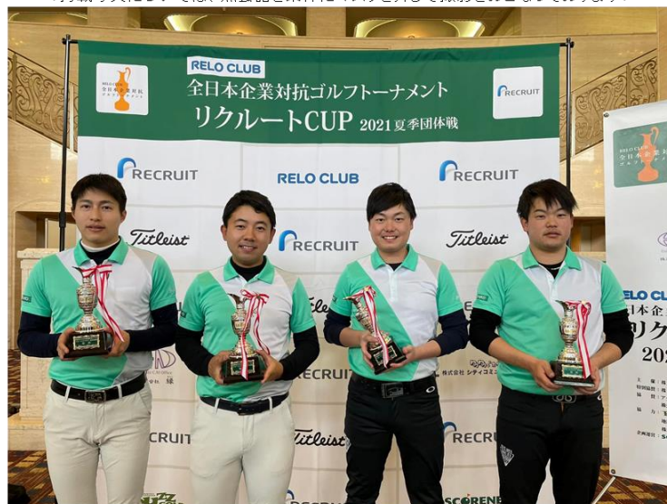
▲優勝したセンコー株式会社「センコーゴルフ部」の皆さん