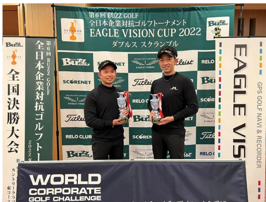
▲優勝した野村證券（Nomura men）のお二人

最近では、かなり認知され始めている“スクランブル方式”でのダブルス戦。参加者、関係者へは感染予防対策がとられ、安全・安心を最優先に競技マナーを順守する78チームにより実施されました。結果は、前半5アンダー、後半4アンダーと安定して好スコアをマークした野村證券株式会社（Nomura men）が、2位に3打差をつけ優勝。副賞として授与されるスペインのテネリフェ島で開催されるワールドコーポレートゴルフチャレンジ2023世界大会（World Final）に、日本代表として招待されます。