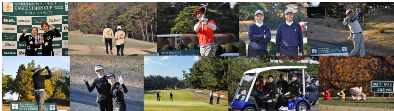
▲2022ダブルススクランブル全国決勝大会の様子