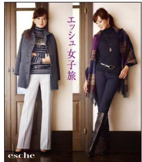
10/24(水)～11/6(火)のパンツフェアでは “女子旅”を提案

“女子会”とは、もともと20代から40代の働く女性たちが集まっておしゃべりをする食事会として、ここ2、3年で名前が定着しており、現在は50代からの大人の女性にも広がりつつあります。「エッシュ」では、「私も“女子会”をしてみたいけど、どこのお店がいいかしら」「かしまりすぎずに、おしゃれなスタイルで“女子会”に参加したい」というお客様の声にお応えし、8月に開催した「チュニックフェア」と連動して、各店舗のスタッフが「エッシュ」の商品を着て地域のおすすめスポットや観光地に足を運んで集めた情報を元に手作りリーフレットを作成。店頭でお客様にお渡ししたところ、大変、好評をいただきました。現在開催中の「パンツフェア」では、“女子旅”をキーワードに、金沢の重要文化財「金沢門」、下関の「関門橋」、札幌の「時計台」、京都の「嵐山」などに最寄店舗のスタッフが、パンツスタイルで訪れ、コメント付きの写真を掲載したリーフレットを作成。お客様とのコミュニケーションツールとして活用しています。