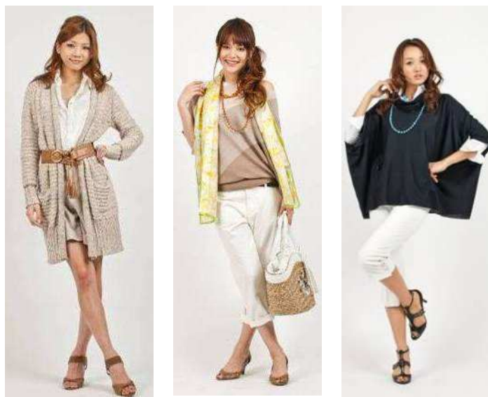
4月2日(土)オンエア「インディヴィ」のコーディネート連動サイト(4/2~) http://www.world.co.jp/wt/rank-up/coorde/

また、CM 連動サイトでは随時放映内容を更新するのに合わせて、CMで紹介した以外のアイテムの紹介や、お客様にお得な特典を紹介するなど、当社の幅広いテイストのブランドを活用し、多くのお客様にご覧頂きます。