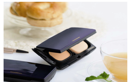
フローレス フィット 2011年9月16日(金)発売(二頁目に詳細)