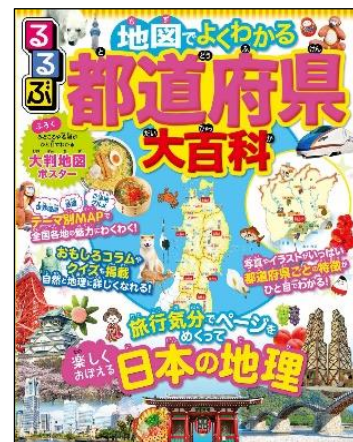
(左から)「るるぶ都道府県いちばんかるた」「るるぶマンガとクイズで楽しく学ぶ! 47都道府県」「るるぶ地図でよくわかる都道府県大百科」