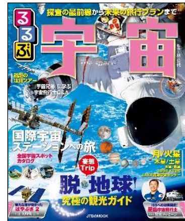
(左から)「るるぶ北海道'24」「るるぶハワイ'24」「るるぶ宇宙」