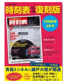
↑第1～3弾も好評発売中