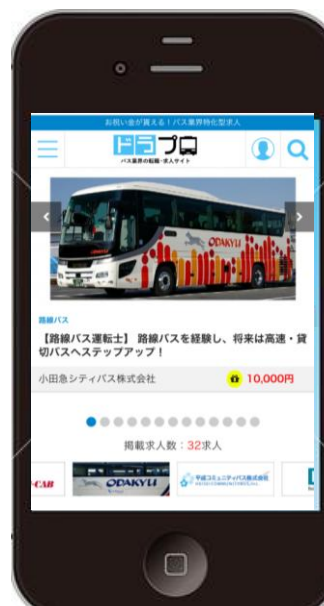
「ドラプロ」スマートフォンサイト トップページ