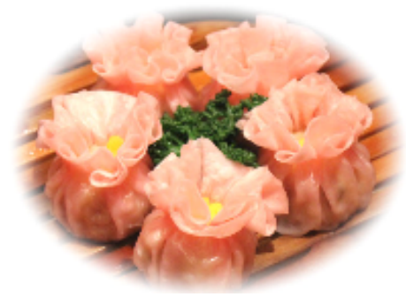
花咲きシューマイ「中国料理」