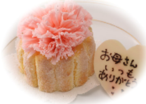
カーネーションケーキ「フランス料理」