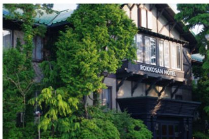
六甲山ホテル旧館外観