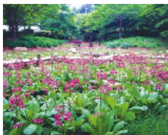
六甲高山植物園(クリンソウ)

さらに「有馬温泉 太閤の湯」では、古くから人々に愛されてきた有馬の名湯「金泉」「銀泉」と人工的に再現した幻の有馬炭酸泉を蒸し風呂、アロマローリュウ、溶岩サウナなど珍しい24種類とお風呂と岩盤浴楽しみながら堪能いただけるほか、6月23日(土)からは敷地内「太閤四季彩園」の紫陽花ライトアップもお楽しみいただくなど、身も心も癒される至福の温泉リゾートを体験いただけます。