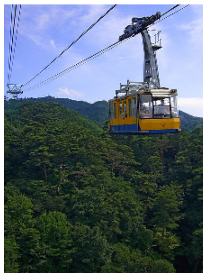
六甲有馬ロープウェー

六甲ガーデンテラス 078-894-2281、六甲高山植物園 078-891-1247