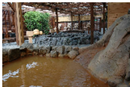
太閤の湯 金泉「太閤の岩風呂」