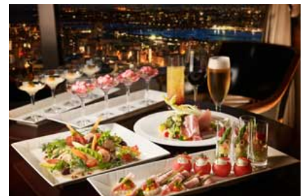
地上130mからの美しい夜景と華やかな料理で贅沢な夏のひととき