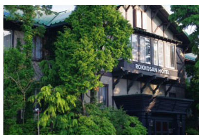
六甲山ホテル旧館外観