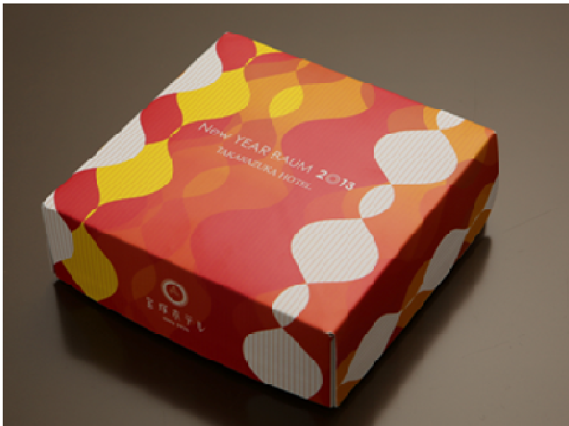
※中身は通常のバウムクーヘンです