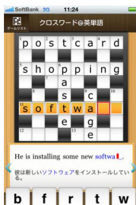
クロスワードパズル