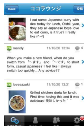
ココラウンジ (英語の交流掲示板)