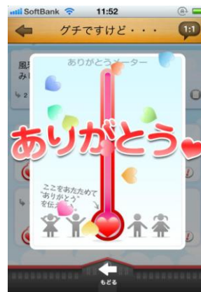
励ましてくれて『ありがとう』