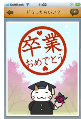
悩みたちの卒業式