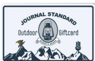
ジャーナルスタンダードギフト券