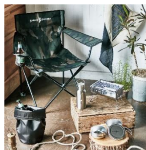
ギフト券利用イメージ

キャンペーンサイト https://event-pasar7.jp/campaign/autumn/index.html