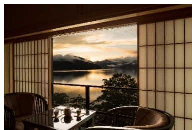
宿泊施設イメージ