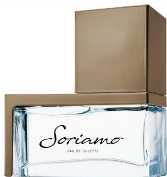
ソリアーモ ダークゴールド オードトワレ 50mL