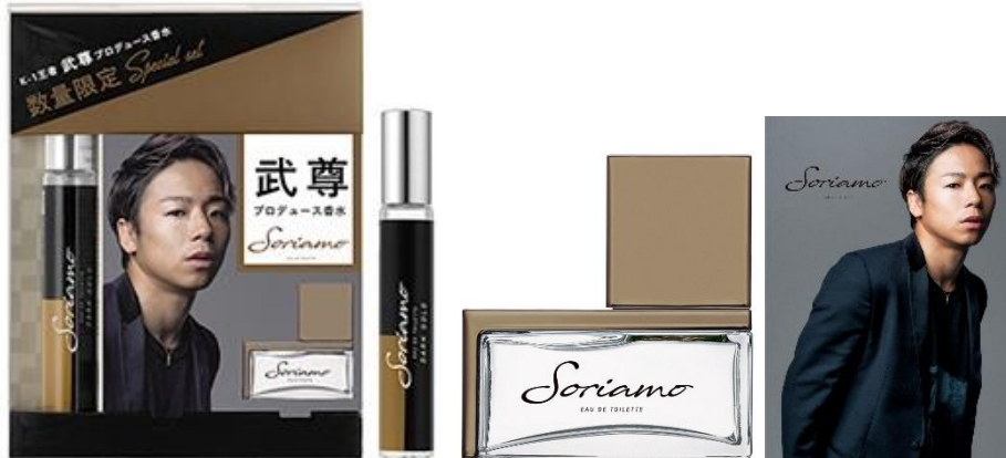
外箱 ミニトワレ 15mL オードトワレ 50mL ポストカード