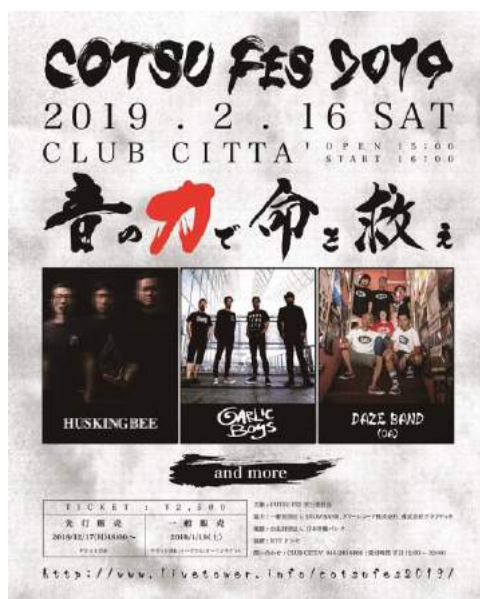
『COTSU FES 2019』キービジュアル

オフィシャルサイト : http://www.livetower.info/cotsufes2019/