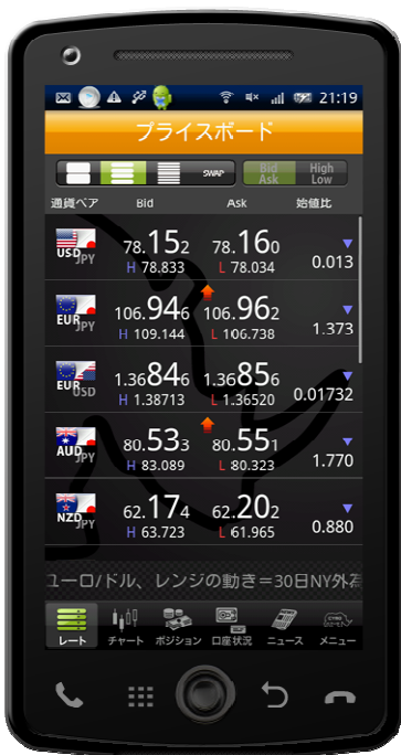
プライスボード中画面