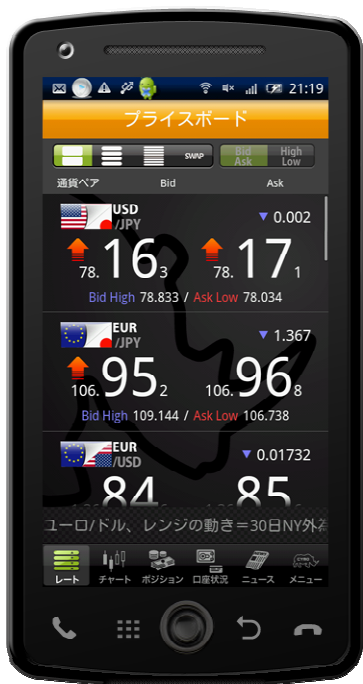
プライスボード大画面

縦フリックでスクロール、横フリックでプライスボード(大・中・小)の表示変更とスワップ一覧の画面の行き来が可能です。通貨ペアの並びについては、カスタマイズも可能です。