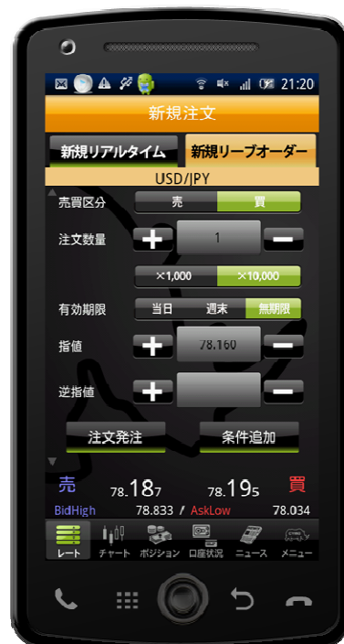
新規リブオーダー画面