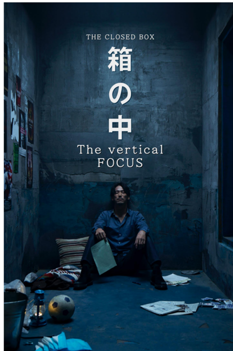
『箱の中 The vertical FOCUS』キービジュアル

SHOWROOM 株式会社(本社:東京都渋谷区、代表取締役社長:前田裕二)は、スマートフォンに特化した、パーティカル(縦型)シアターアプリ「smash.」にて、2020年12月5日(土)より、EXILE/三代目 J SOUL BROTHERS from EXILE TRIBE 小林直己が主演を務めるオリジナルドラマシリーズ『箱の中 The vertical FOCUS』の独占配信をスタートします。本作は、小林直己の Instagram と連動する、新感覚ミステリー・ヒューマン・ドラマで、同じ出来事を、Instagram では横型画面で、「smash.」では縦型で展開していきます。さらに、「smash.」の『箱の中 The vertical FOCUS』では、Instagram では映しだされない、オリジナルエピソード・第5話「想い」を初公開。同じシチュエーションを別の角度で映し出し、さらに深堀することで視聴者に没入感を提供する、新たな試みに挑戦しています。