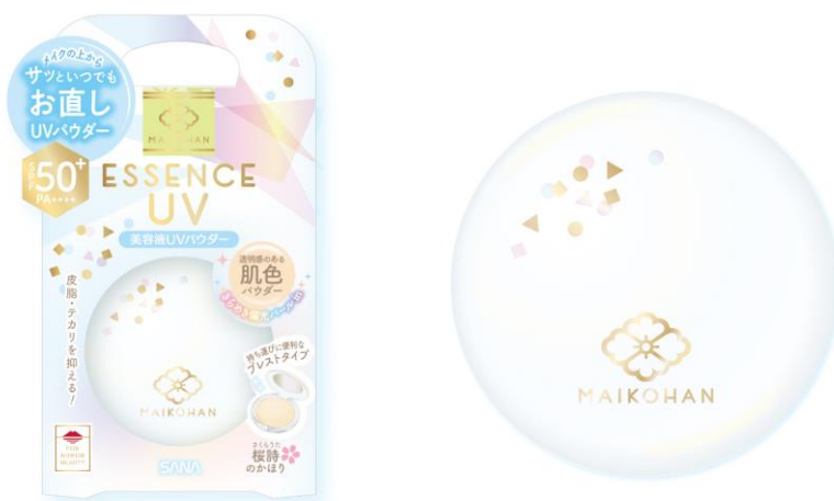
サナ 舞妓はん 美容液UVプレストパウダー 13g 1,500円（税込1,650円）