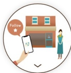
店長さんや「街の人」を フォローする