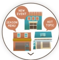
街の“今”を 「キョウドコ」で知る