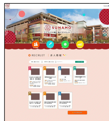
南砂町ショッピングセンターSUNAMO

専門店の各原稿にWEB応募機能を実装することにより、いつでも応募することが可能になります。応募いただいた求職者情報は、リアルタイムで各専門店へお知らせします。