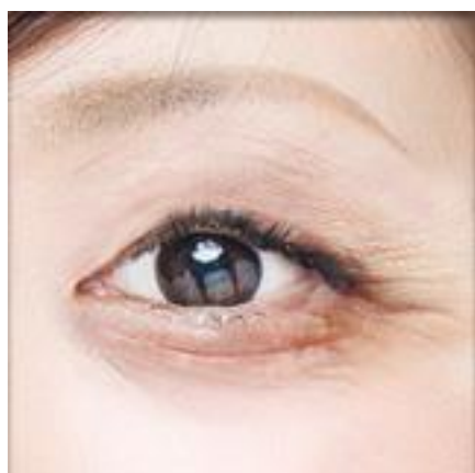
タルミやユルミのある目元