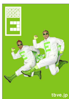
待ち受け画像(3種類)