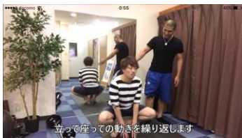
カエルスクワット (脚)

トレーナーが考案したトレーニングメニューにはトレーニングの動画を見ながら自ら行うことができる。30本以上の動画を収録しているのでさまざまなトレーニングを見ながら挑戦できるため十分に満足できる内容となっている。