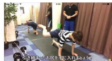
サイドヒップレイズ (お尻)