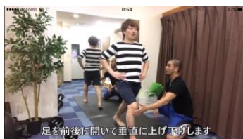
ランジスクワット (脚)