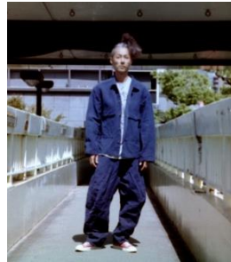
ブランド名：ink (インク) https://www.ink-web.net

大阪に根付き、さらに東京でも活躍しているファッションブランド。 出展者：ink, RYU, wonderland