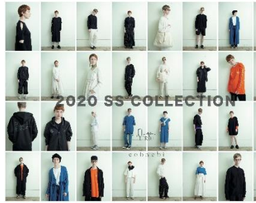
ブランド名：RYU (リュウ) https://cobachi.jp/