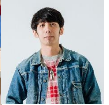
ブランド名：good Walkin (グッドウォーキン) アイテム：刺繍キャップ https://www.instagram.com/uedaayumu/?hl=ja