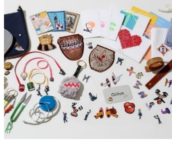
ブランド名：Giiton (ギートン) アイテム：刺繍シールワッペン、 マクラメキット、 ハンカチ刺繍キット