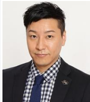
長田庄平 (チョコレートプラネット)