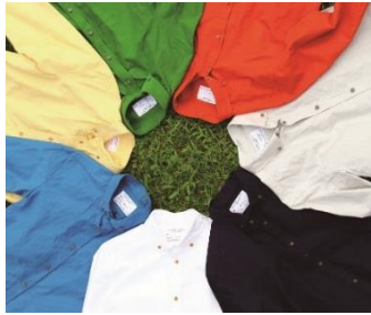
ブランド名：sunny day tailor (サニーデイトーラー) アイテム：Men's Wear, Women's Wear https://www.sunnydaytailor.com

大阪を代表するアパレル企業や、注目の若手ブランド、新進デザイナー、個性豊かなラインナップ。アクセサリ、雑貨、アパレルなど。 出展者：81's, FLAMINGO, fuyuji, good Walkin, Gosh, MAGNET, MOYA, numero uno io, omamori BAG, Parrish, Pielpie, RBTXCO, Seri Hano, SKEROCK, sunny day tailor, Unik, WallRAG, WONDER WOO, yemao, yularice, WADMYC! ほか