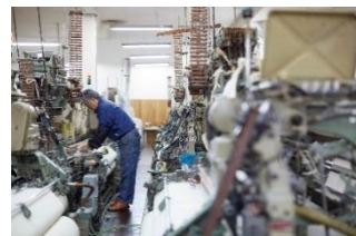
ブランド名：SHINTO TOWEL (シントータオル) アイテム：タオル http://shinto-towel.jp

大阪の技術、素材など、大阪でしかできないモノづくりをするブランドや企業。 出展者：ennhüt, SHINTO TOWEL, TSUNEKICHI, KITPLUS ほか