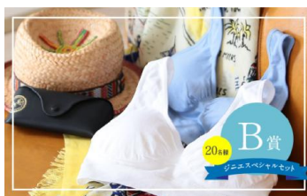
ジェシカさんサイン入りフォトカード&ジエスペシャルセット (ジエレーシブラ&ショーツ、ジエブラエアー、キャンディフロスブラ&ショーツのセット)