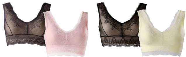
ネイビー・ピンク