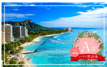
プリンス ワイキキ宿泊券 (ペア1組&3泊分)