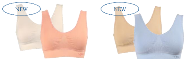
パカンス/ココナッツ・ピーチピンク リラックス/モカベージュ・ブルーベリー

※1 通気性従来製品より2.9倍アップ（背面部分）。透湿性もアップ。共にジエブラ従来品との比較。一般財団法人ポーケン品質評価機構調べ