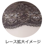
レース拡大イメージ

Point2. ラグジュアリーな総レース 光によって違う表情を魅せる繊細なレースが、肌をより一層上品に 美しく演出。白シャツ、カットソーから見せても◎