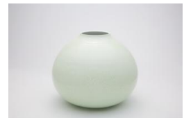
〈代表作品〉 黄磁釉 花瓶（菊）

〈講評〉九谷焼の伝統工芸士。気品に満ちた作風は若手の信望も厚く、異業種とのコラボでも脚光を浴びている。その技術を継承するべく40年前の独立時より弟子をとり、職人を多数育成。さらに、若手作家を対象に自工房で研修を行うなど、後継者育成に力を注いでいる。また、県の工業試験場と磁器坯土（はいど）を共同開発するなど、原材料の確保や道具、機器の改良にも尽力。こうした九谷焼の発展を支える地道で幅広い活動が評価された。