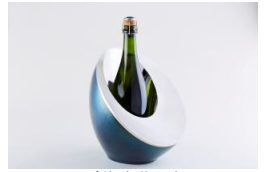
〈代表作品〉 鋸起和器 MOON

〈講評〉燕鋸起銅器を200年に渡って受け継ぐ老舗の後継者として、海外ブランドとのコラボレーションや異業種との新製品開発などに尽力。自分たちで作った製品を自らの手で丁寧に販売するという信念を軸とした、百貨店との直接取引や直営店舗設立といった流通機構改革への実績が評価された。また、終業後は工場を職人に開放し、若手の技術訓練やベテランの作品創作にチャレンジする場として提供するなど、若手育成や技術力向上の環境を整え、世界最高峰を自負する技術・技能継承へのきめ細かな就業体制を作っている。