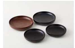
〈代表作品〉 蒔地小福皿、千すじ小福皿

〈講評〉江戸後期から続く漆器業の7代目。分業主流の輪島産地で、先駆けて木地、漆塗りの一貫生産を実現し、消費者ニーズへの対応に努め、長年にわたって産地の改革と活性化に取り組んだ実績が評価された。現代の様々な生活シーンに馴染む漆器や家具、建築内装材を国内外へ幅広く提案している。さらに、産地内の若手、中堅、漆芸研究所生徒等40数名を集めた「輪島クリエイティブデザイン塾」などの事業を推進し、後継者育成にも尽力している。