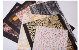
〈代表作品〉 ギルディング和紙

〈講評〉昔ながらの書道用半紙や障子紙が主流であった大洲和紙産地において、壁紙やタペストリーといったインテリア素材への進出を図り、新たな和紙のある生活を創出した。フランス伝統の金属箔技法ギルディングを取り入れた世界にオンリーワンの和紙や、地元商工会とともに開発したこより和紙など、デザイン性の高い和紙を次々に発表。新たな和紙需要の拡大に努めながら大洲和紙産地の活性化に大きく貢献していることが評価された。