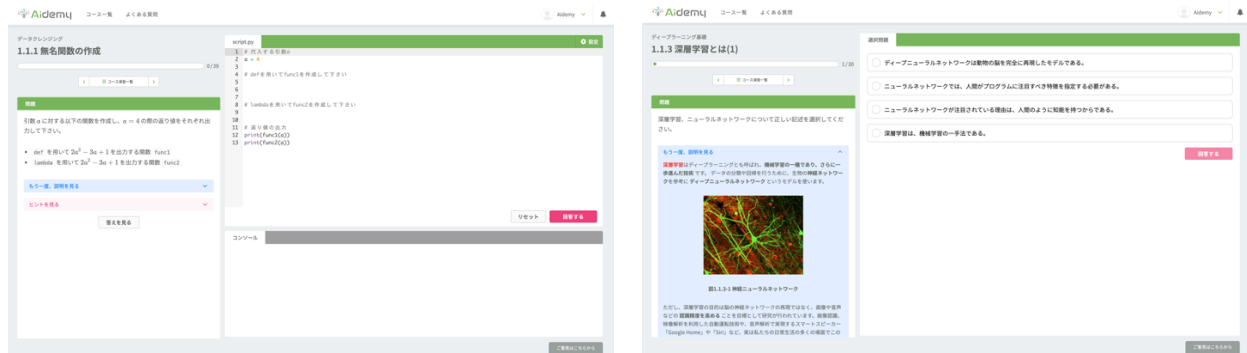
▲Aidemy の演習画面の例(左:コードを書きながら学習する問題, 右:クイズに答えながら学習する問題)▲