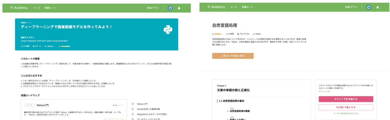
▲Aidemy の教材(左:受講ルートページ, 右:受講コースページ)▲