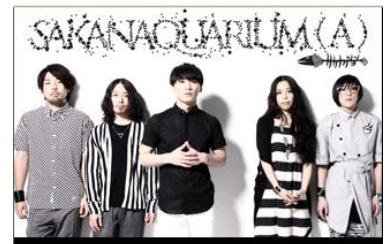
NEW MAXI SINGLE

サカナクションの最新ニュース、メディア・ライブスケジュール、ディスコグラフィなどコンテンツを無料で提供するほか、会員登録をいただくとメンバーブログ「サカナのわた」やラジオコンテンツ、動画、Q&A、パースデーメール、STAFF DIARYなどがお楽しみいただけます。スマートフォン向けにはアーティスト発信によるメディア「SAKANAQUARIUMEDIA」コーナーを立ち上げ、端末性能の高さを生かした高品質なストリーミング動画や音声コンテンツ、ライブ写真やロゴ・イラストを活用した解像度の高い壁紙を配信します。モバイルサイト向けには、メンバーが演奏・打ち込みするオリジナル着サウンドを独占配信するほか、カレンダーや時計として使える待受画像・Flash、デコメールなどを提供します。今後も、会員限定チケット先行予約など、ファンのニーズを満たすサービスを順次展開します。