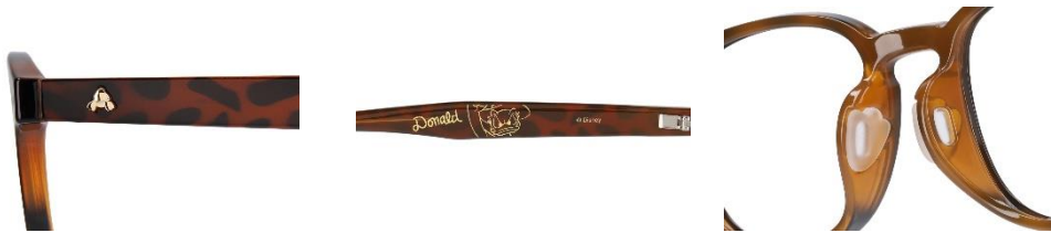
写真 : ZA231032_49A1