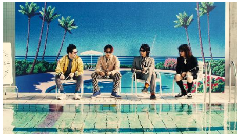
OKAMOTO'S がプールで釣りをしていると