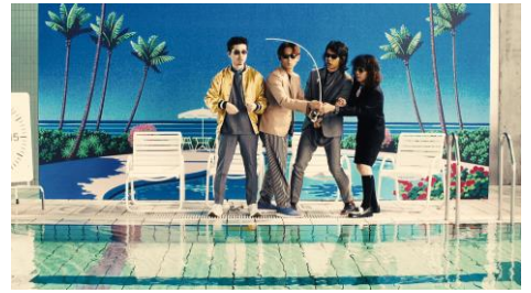
大物が食いついた！