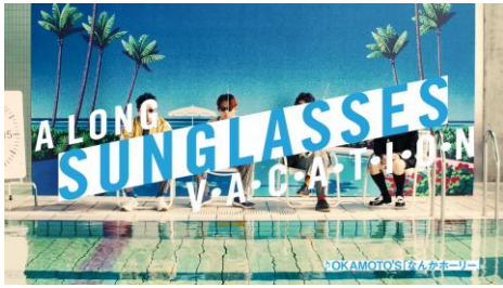
OKAMOTO'S & MAPPY プールで釣り篇