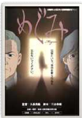
北朝鮮拉致問題 「アニメめぐみ」 (2008年)