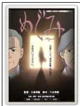
北朝鮮拉致問題 「アニメめぐみ」 (2008年)