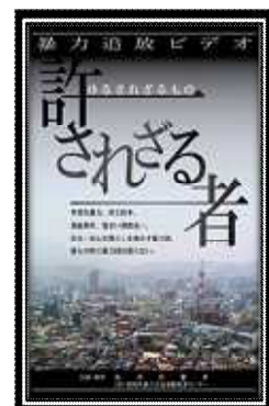
暴力団追放 「許されざる者」 (2010年)