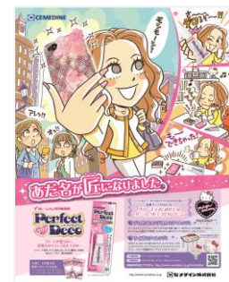
第49回 セメダイン 「あだ名が 匠になりました。」