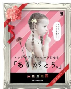
第49回 アテックス 「マッサージは メッセージになる」