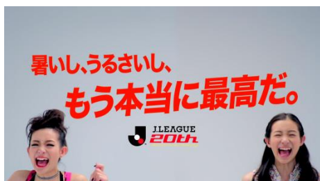
第49回 Jリーグ 「暑いし、うるさいし、 もう本当に最高だ。」