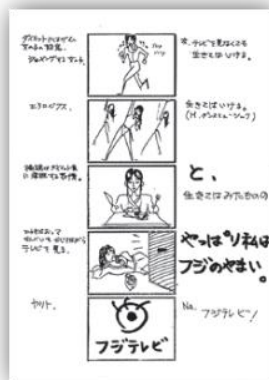
1988年（第26回） 山田尚武（電通） 課題：フジテレビジョン