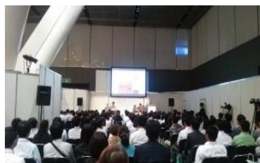
講演会場(昨年の様子)