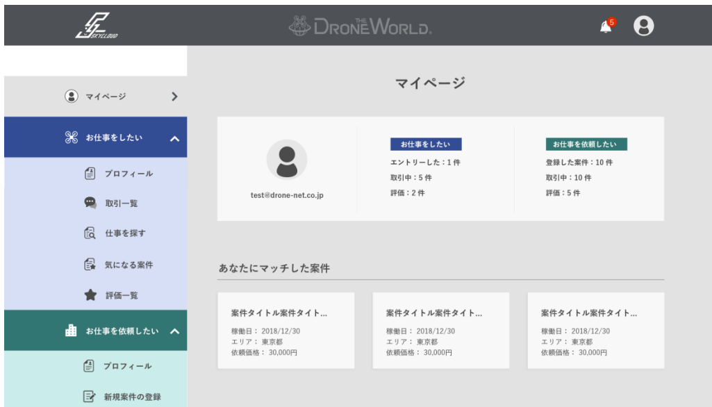
▲実際のマイページ

「スカイクラウド」は、ドローンに関する技能/過去実績/保有機種/空撮作品等の情報を開示可能なドローン人材に限定したサービスとなっており、ドローン業務依頼者に安心してご依頼していただけるとともに、優秀なドローン人材の活躍の場も広がっていきます。