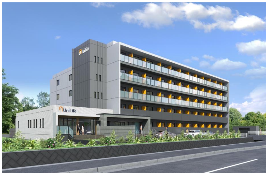
「Uni E'terna 山口吉田学生会館」 完成予想図