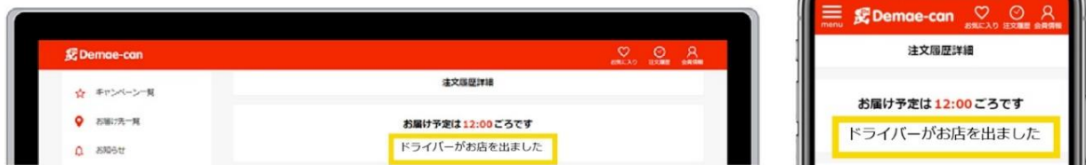
出前館サイト注文履歴ページ

今回のリニューアルにより、『出前館』が配達代行を行っている店舗で注文した場合、注文履歴ページで配送状況が見られるようになります。よりタイムリーに配達状況を確認することができます。