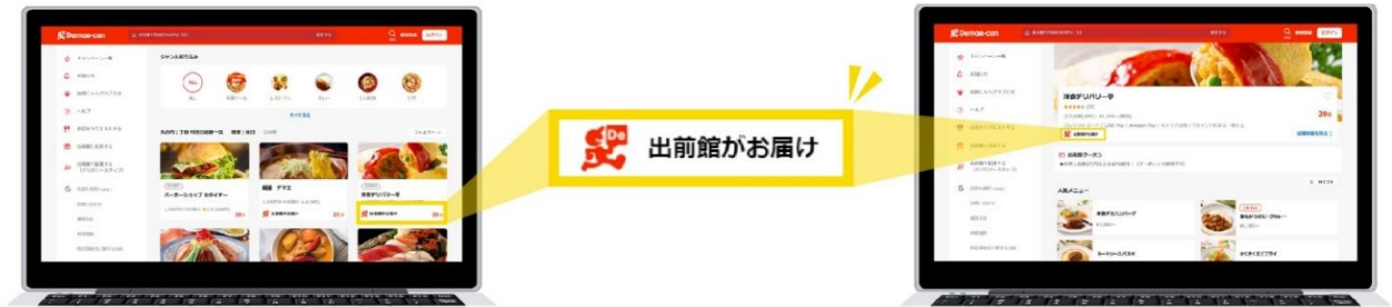
出前館サイト店舗一覧ページ